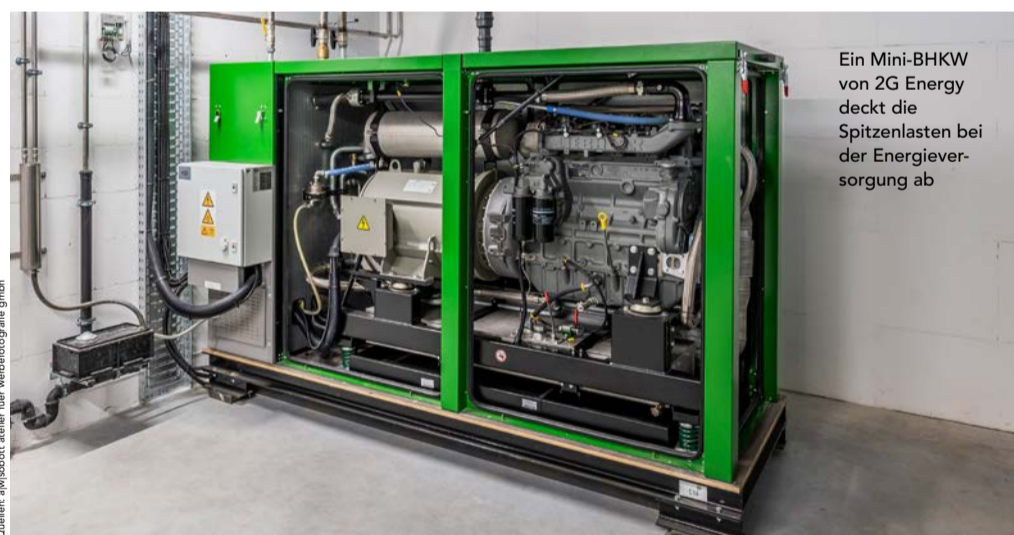
Ein Mini-BHKW von 2G Energy deckt die Spitzenlasten bei der Energieversorgung ab