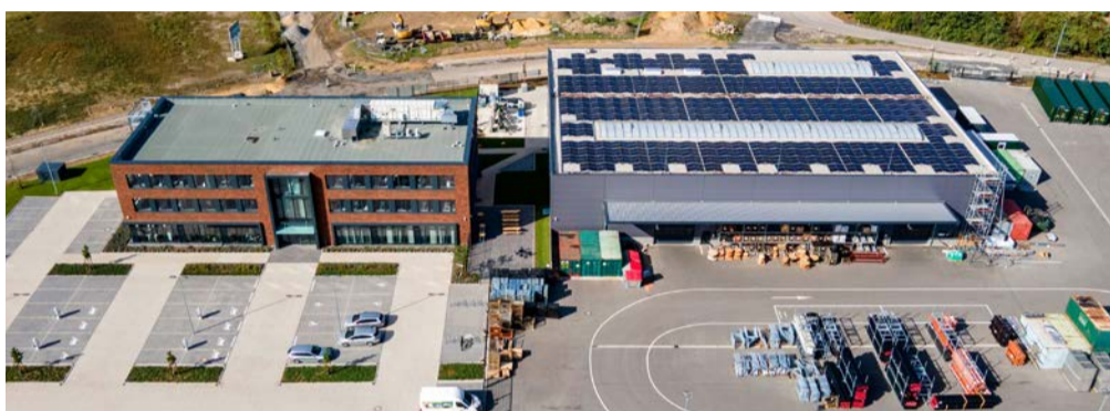
Die neue Firmenzentrale der PlanET Biogas Group GmbH in Gescher

Bei dem Gebäudeenergiekonzept achtete man „insbesondere auf Nachhaltigkeit“, so das Unternehmen. Die Energiezentrale wurde in die Werk- und Lagerhalle integriert. Darin untergebracht ist unter anderem ein Mini-Blockheizkraftwerk vom BHKW-Hersteller 2G Energy aus Heek. Es hat 50 kW elektrische und 100 kW thermische Leistung und wird mit Biomethan aus einer emsländischen Biogasanlage über das Erdgasnetz versorgt. Das BHKW deckt vor allem die Strom- und